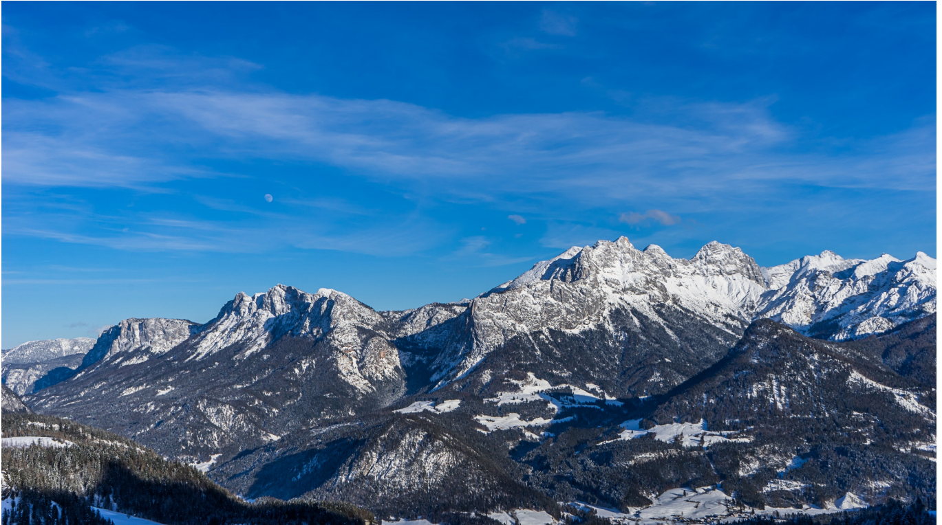
St. Martin bei Lofer, rechts das große Hundshorn, dahinter Häuselhorn und Wagendrischlhorn